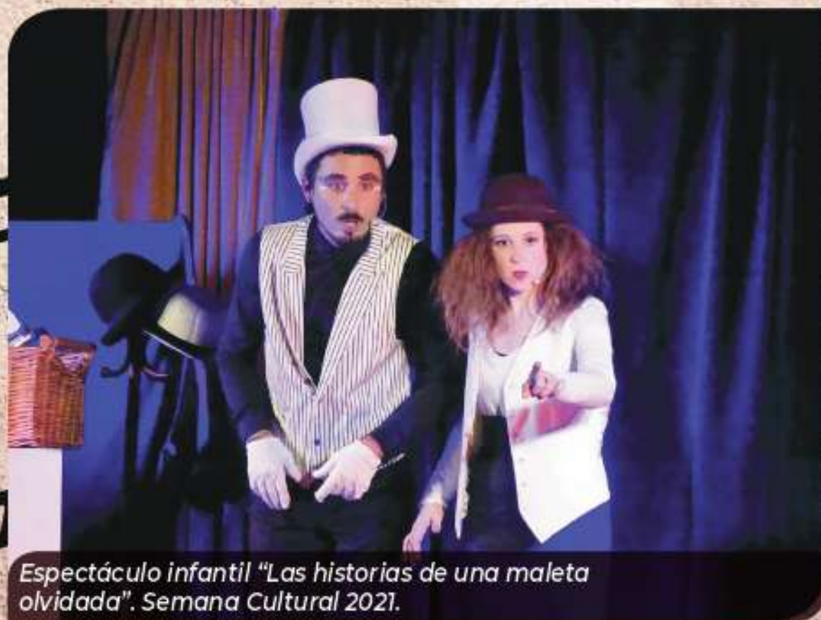
Espectáculo infantil “Las historias de una maleta olvidada”. Semana Cultural 2021.